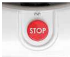
Pulsante Push Stop