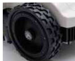
Doppia ruota profilo gommato