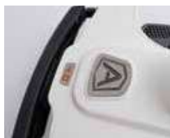
Paraurti e sensore ostacolo morbido