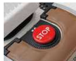
Pulsante Push Stop