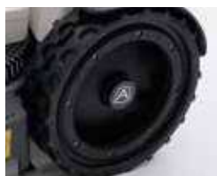
Doppia ruota profilo gommato