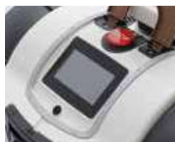
Display touch screen