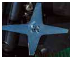
Lama stella 4 punte