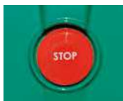
Pulsante Push Stop