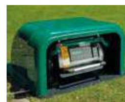
Robot in fase di Ricarica