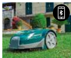
Ricevitore Bluetooth + App