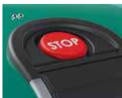
Push Stop e sensore pioggia

Ricevitore Bluetooth Per trasferire gli aggiornamenti del software da Smartphone/Tablet al robot ed utilizzare la App "Ambrogio Remote" da iOS e Android.