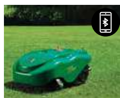
Ricevitore Bluetooth + App