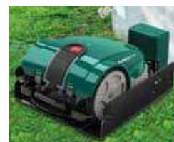
Robot in fase di Ricarica