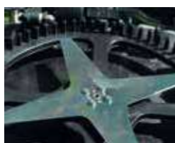
Lama stella 4 punte